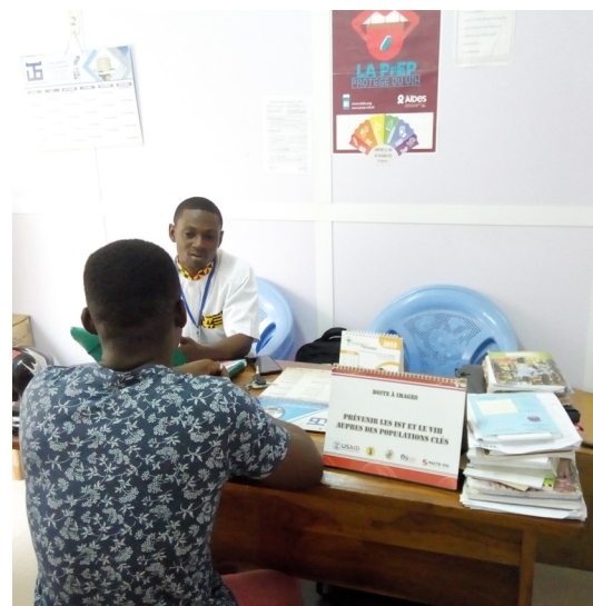
Sépopo chez son accompagnateur PrEP pour le suivi et l'accompagnement