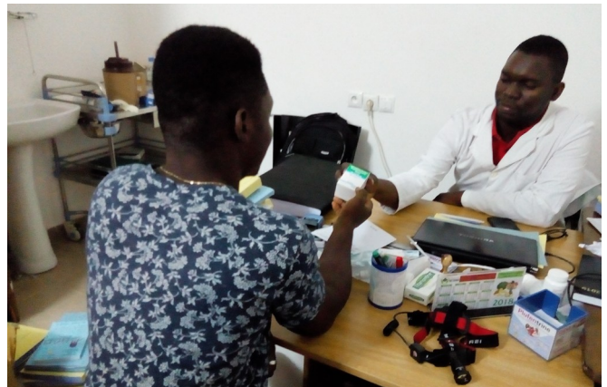
Sépopo lors de sa séance de renouvellement de la PrEP chez son médecin

Sépopo: Oui bien sûr. Il existe des accompagnateurs PrEP qui discutent avec moi par rapport à l'observance. Des causeries éducatives sont également organisées me permettant de partager mes difficultés et mes vécus quotidiens liés à la PrEP